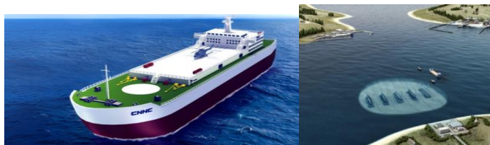
Fig. 2-NPP flottant ACP100S développé par CNNC Fig. 3 – Seanergie : un SMR immergé